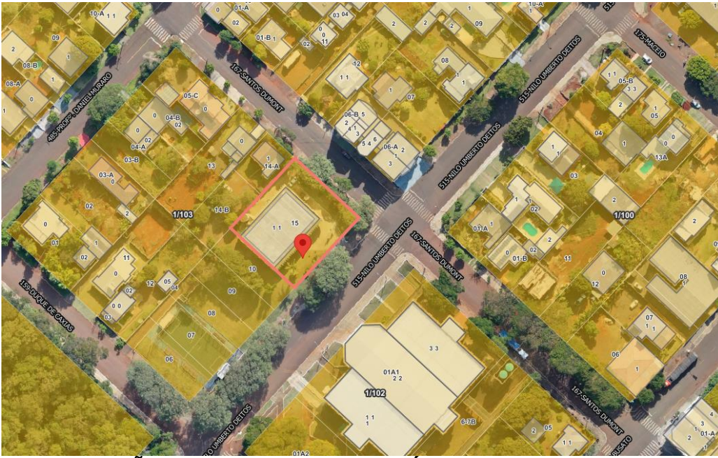
LOCALIZAÇÃO DO PAÇO MUNICIPAL A SER INSTALADO O ELEVADOR

CNPJ 76.206.473/0001-01 – e-mail: licitacao@ceuzul.pr.gov.br